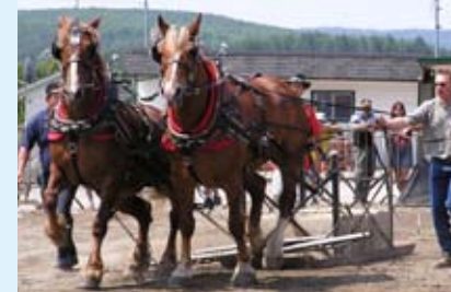
Compétition régionale de tire de chevaux

Né en 2000, L'Événement Country Western de La Trinité-des-Monts offre durant la première fin de semaine de juillet, des sports équestres, de la danse et des spectacles musicaux.