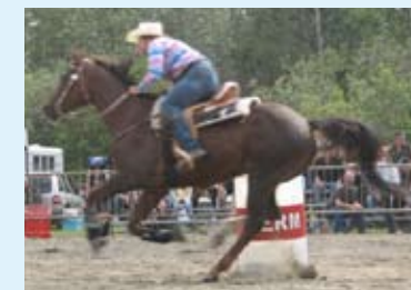
Compétition provinciale de gymkhana